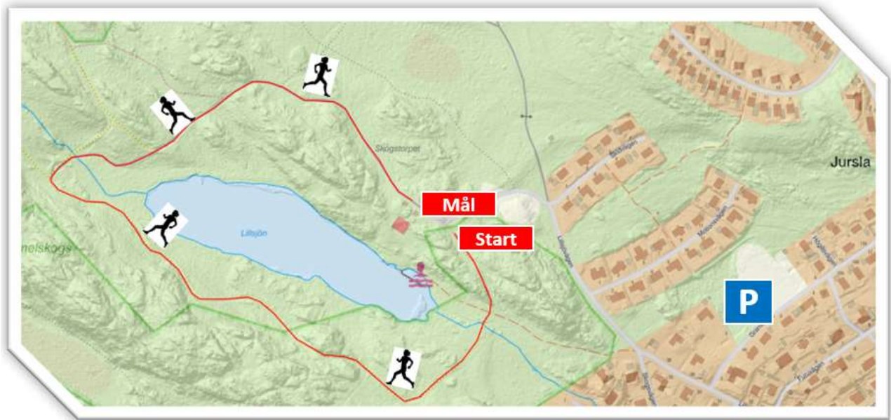
Bansträckning 1,4 km

Deltagare som har vistats i skogsområden i Fagersta eller i Östeuropa uppmanas att rengöra skor och kläder ordentligt innan man kommer till Höstmilen. Matrester får inte kastas i naturen.